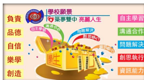
圖2 雙園國中學校願景圖

學校將學生視為待開發之寶庫，使用三把鑰匙(行政績效服務、教師專業發展、家長正向參與)，開啟學生內在「自信、負責、樂學、創造與有品」五項重要特質，培養具備「自主學習、溝通合作、問題解決、創思執行、資訊運用」五大校本素養的雙中學子，期許每個學子都能「築夢雙中，亮麗人生」。