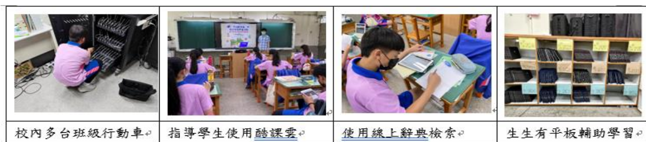
表8 學生自備載具（BYOD）到校計畫執行表